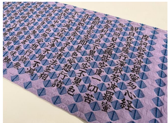
▲ログウッドで染め上げる前と染め上げた後